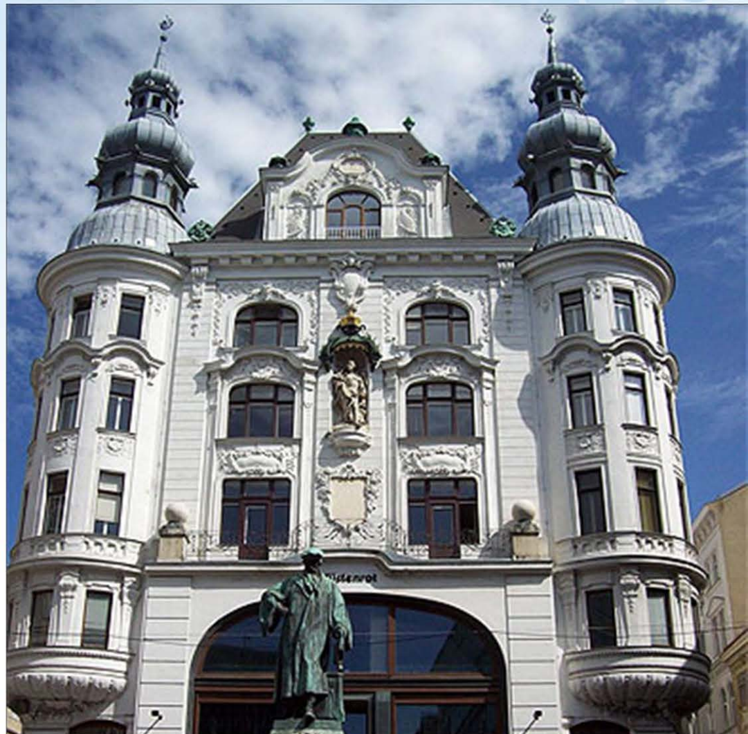
Statue de Gutenberg à Vienne (Autriche) Gutenberg's statue in Vienna (Austria)