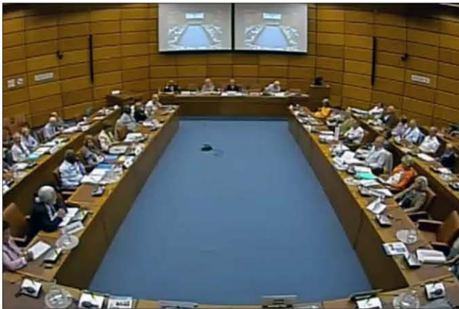
FAFICS Council, Vienna International Centre